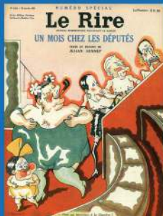
Dessin de Jehan Sennep en couverture du Rire , « Un mois chez les députés », 31 janvier 1931 (© ADAGP, Paris 2013).