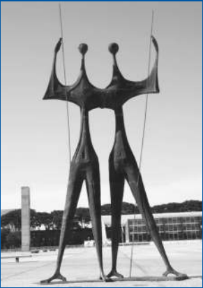
Photo ci-dessus : Os Candangos.