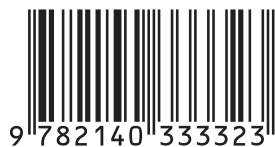
Image de couverture