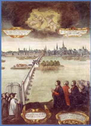
Bannière de la ville d'Orléans rendant grâce pour la libération de la ville en 1429 (première moitié du XVI e siècle, Orléans, Musée archéologique et historique de l'Orléanais).