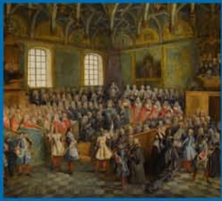
En couverture : Le Lit de justice tenu au Parlement à la majorité de Louis XV (22 février 1723), huile sur toile de Nicolas Lancret, 1723 (musée du Louvre). Présentation pp. 138-143.