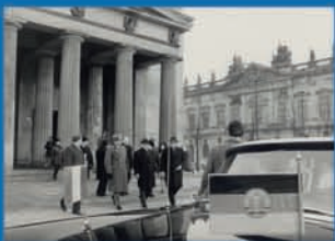
Visite officielle d'Edgar Faure à Berlin-Est en janvier 1974, présentation pp. 129-131.