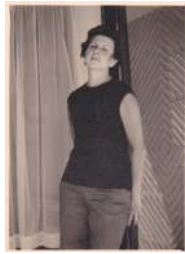
Années 60, en Algarve