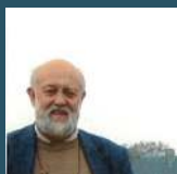
Image multinationalisée de Salvador de Bahia, pyramide néo-concrète, Idade da Terra (L'Âge de la Terre) , son dernier film, réitère pour chacun d'entre nous le message d'espoir du chanteur aveugle dans Deus e o Diabo na Terra do Sol (Le Dieu noir et le Diable blond) : « Qu'ainsi, mal partagé, ce monde va de travers, que la terre est à l'homme, elle n'est ni à Dieu, ni au Diable. »