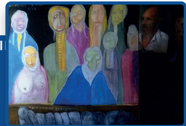
Illustration de couverture de l'auteur