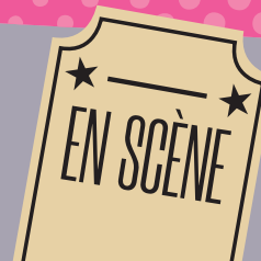
Illustration de couverture : © J. Allain - Jalka Studio