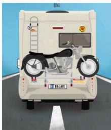
Illustration couverture : © Florian Joseph

Comment protéger le conjoint survivant ? Comment aider ses enfants et ses petits-enfants ? Comment affronter la perte d'autonomie de ses parents très âgés ? On trouvera dans cet essai les réponses à ces questions que l'on pose régulièrement à son notaire quand on vient de fêter ses « 65 balais ». Et l'on verra se dessiner, à partir de rappels historiques et de références sociologiques, le portrait de ce post soixante-huitard, jeune et sage à la fois, qu'une mise en parallèle avec son alter ego du début des années 1970 permet de bien comprendre.