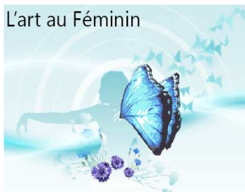
Au Viaduc Des Arts