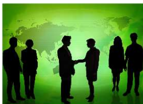
Afrique-France: for a new green Deal

December 17th to the Parisian siege of the French Institute of the International Relations (IFRI) an international existed conference Energy, growth and sustainable development, an African equation. This conference was organized by the Secretariat department of the Fiftieth anniversary of the African independences, in association with the Ministry, the Sustainable development, Transport and the Accommodation, and the program sub-Saharan Africa of the IFRI.