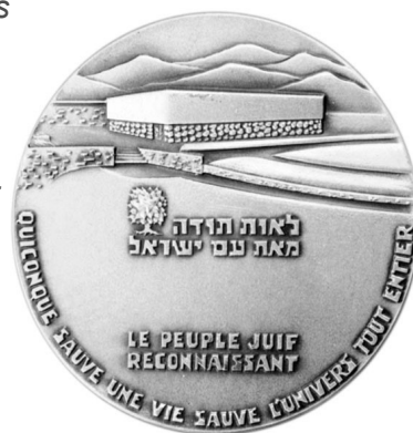
Médaille des Justes de Yad Vashem

Il ordonne la lecture publique le 23 août 1942 dans son diocèse d'une lettre pastorale restée célèbre dans laquelle il affirme : « Les Juifs sont des hommes, les Juives sont des femmes... Tout n'est pas permis contre eux... Ils font partie du genre humain. Ils sont nos frères comme tant d'autres. Un chrétien ne peut l'oublier. ». Bien qu'interdite par arrêté préfectoral, la lecture de cette lettre a tout de même lieu dans la plupart des paroisses et fut surtout, sera reprise et diffusée sur les ondes de la BBC à Londres.