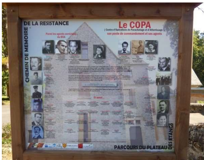
Panneau dédié au réseau COPA corrèzien à Saint-Pardoux-la-Croisille

Chaque « COPA » choisissait ses terrains de parachutages et d'atterrissage où il recevait l'aide matérielle des Alliés (armes, vivres, habillement). Des instructeurs y étaient parachutés pour créer des écoles d'instruction d'armement et de sabotage (de lignes électriques, de voies ferrées, d'usines dont l'activité servait l'occupant...). Des spécialistes « radio » y installaient des émetteurs et transmettaient les informations sur les mouvements de l'ennemi. Le COPA développe ses camps dans notre secteur dès septembre 1942 où les réfractaires du STO trouvent refuge, comme dans les bois du Quinsac, à Combenègre, à Bassignac-le-Haut, à Clergoux... Autant d'hommes et de femmes qui ont participé à la lutte et à la Libération de la France.