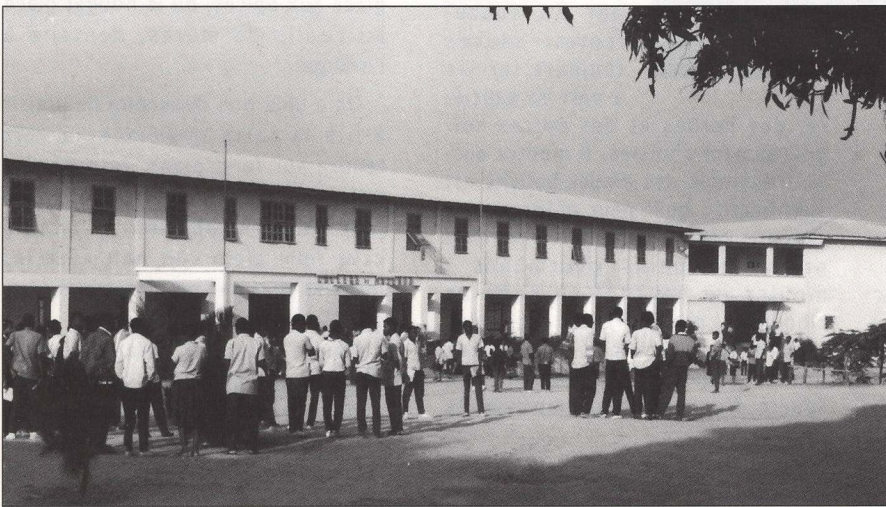
Le collège de Mazenod, à Ngaoundéré